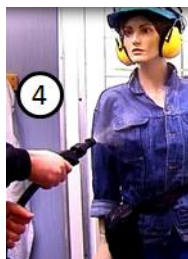
Bild 4. Spruta med spraymunstycket.