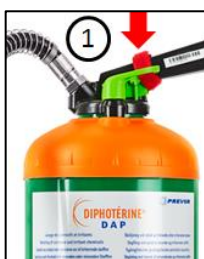
Bild 1. Säkerställ att den röda transportsäkring ALLTID är borttagen.

Sköljinstruktioner finns att ladda ner från vår hemsida www.medicalcare.se/dokumentation .