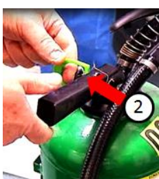
Bild 2. Dra ut den gröna säkerhets-sprinten.