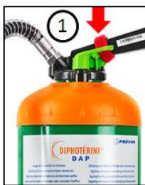
Kuva 1. Varmista AINA että punainen kuljetuslukko on poistettu.

Aloita huuhtelu minuutin sisällä onnettomuudesta. Huuhtele ensin paljaalle iholle. Poista sitten vaatteet ja/tai piilolinssit. Riisuutumisen jälkeen jatka välittömästi huuhtelua paljaalle iholle. Seuraa erikseen kirjallista käyttöohjetta. (Katso kuvaa 5.) Kaikki käyttöohjeet löydät myös meidän kotisivulta. http://www.medicalcare.se/dokumentaatio/