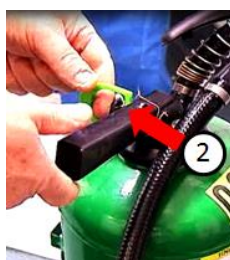
Kuva 2. Poista vihreä tappi vetämällä.