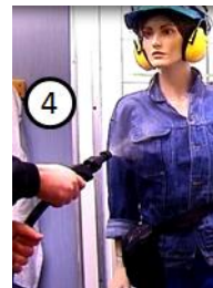
Kuva 4. Levitä neste letkun suuttimella.