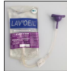
Kuva 2: Valmiiksi asennettu pussi